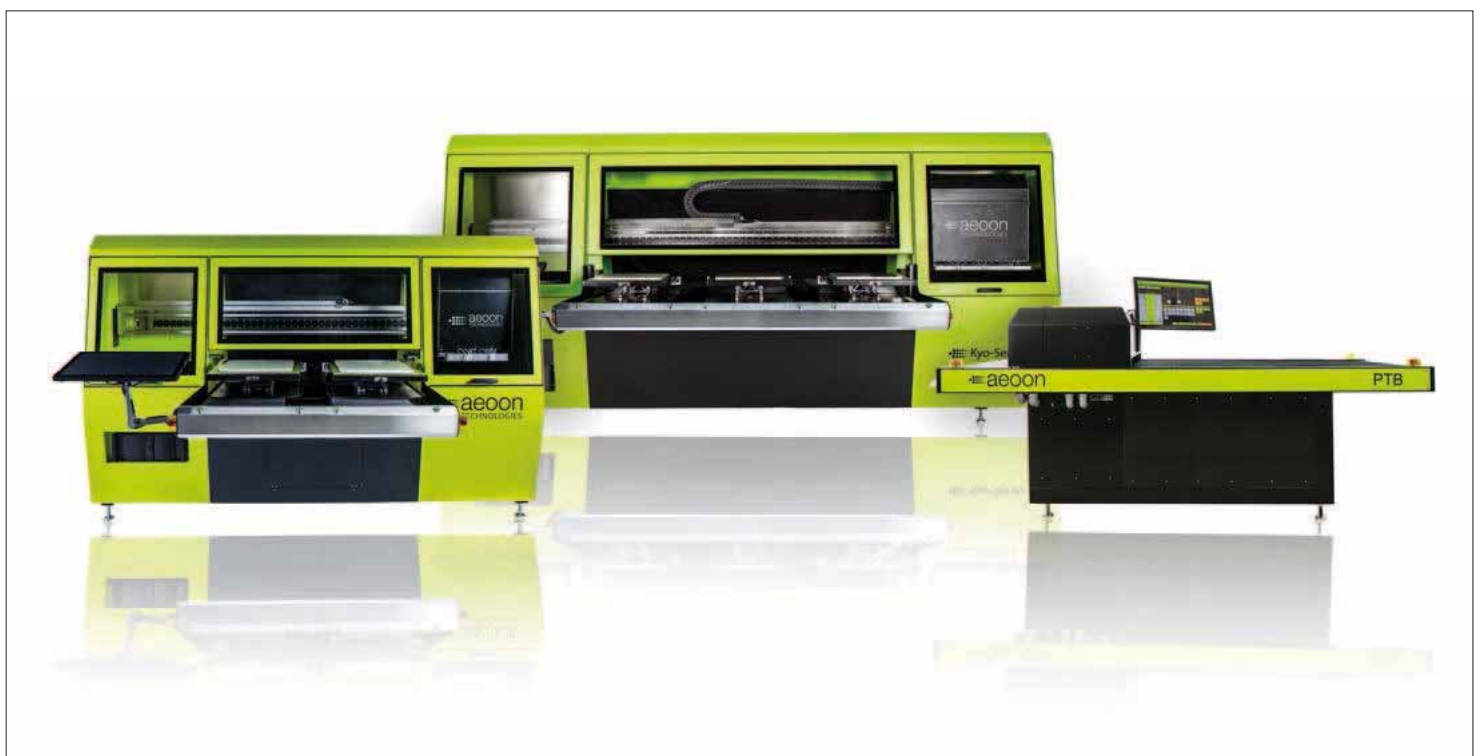
Aeoon: pre-trattamento e finiture sono due aspetti molto importanti per la stampa digitale tessile

Janine Somweber – Aeoon è interessante soprattutto per mercati della stampa print-on-demand, promozionale e per produttori di moda.